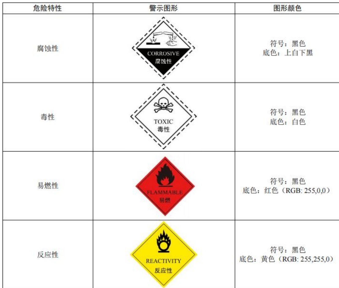
图 5.6-1 危险废物类别标识示意图

c. 材料应坚固、耐用、抗风化、抗淋蚀。危险废物相关信息标签如图 5.6-2 所示。