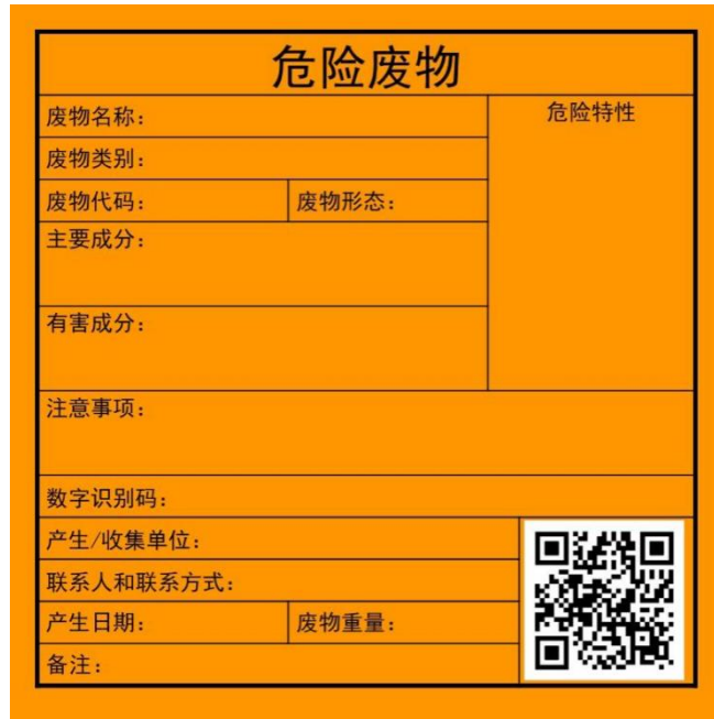
图 5.6-2 危险废物相关信息标签

d、装载液体、固体的危险废物的硬质桶内必须留足够的空间，硬质桶顶部与液体表面之间保留 100mm 以上的空间。