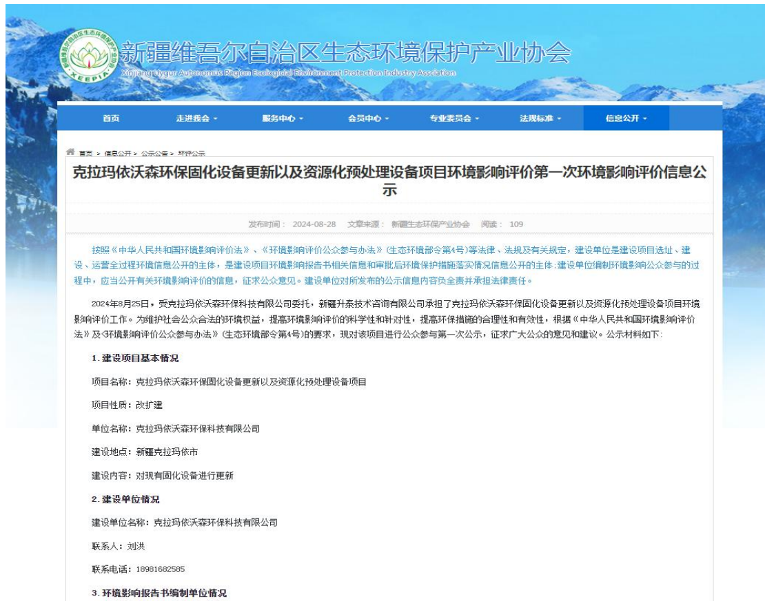
图 2.2-1 首次网络公示