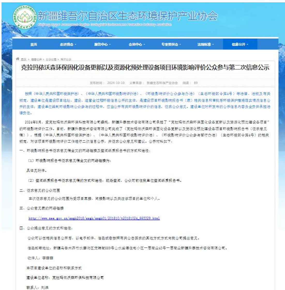
图 3.2-1 征求意见稿网上公示