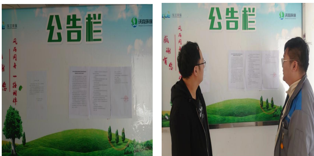
图 3.2-3 张贴公告